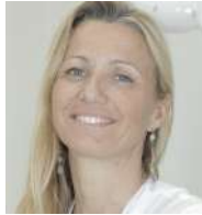
Claudia Dellavia et al. Clin Implant Dent Relat Res. 2021